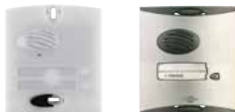
Ensemble interphone SC900AF