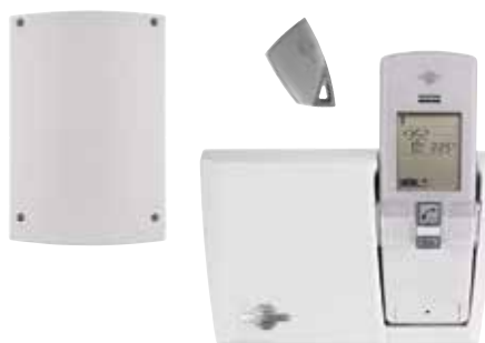
Ensemble interphone SC902AF